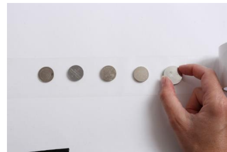
2- placez les piles les unes à côté des autres sur la bande