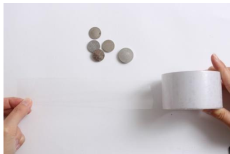
1- étalez du scotch, partie collante au-dessus