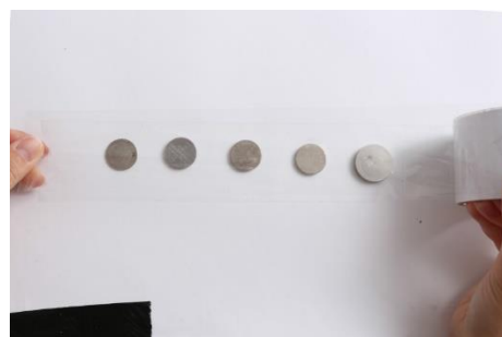
3- recouvrez de scotch