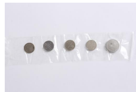
4- les piles sont sécurisées !