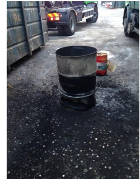
Exemples de fûts de piles bouton lithium issus d'étiquettes électroniques ayant pris feu.

NB: si quelques étiquettes électroniques montrent des signes de « fatigue », il est courant de remplacer les piles de toutes les étiquettes afin d'éviter une panne généralisée. Toutefois, la plupart des piles contiendront encore une énergie résiduelle, ce qui pourra augmenter le risque et la puissance du feu.