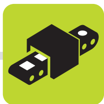
FABRICATION DE NOUVEAUX OBJETS