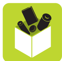
CUBE À PILES

➔ Dans une pile ou batterie, jusqu'à 80% DES MÉTAUX SONT RECYCLÉS pour être utiles au quotidien.