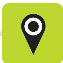
POINTS DE COLLECTE