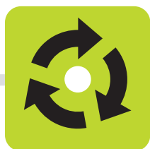
TRI ET RECYCLAGE